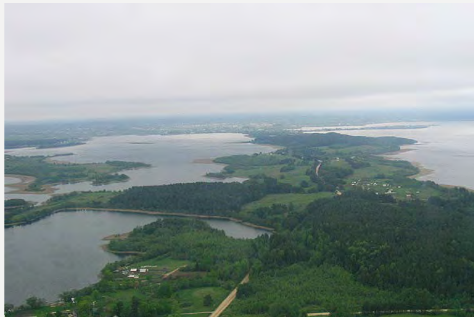
Себежский национальный парк